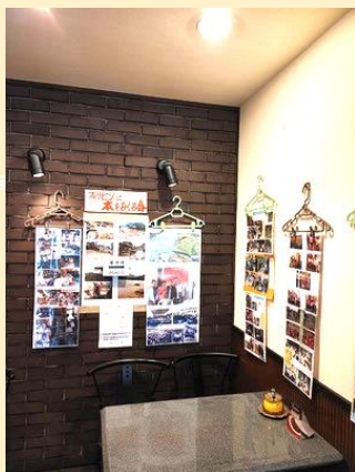
フィリピン台風被害の状況を報告するディスプレイと寄付の呼びかけ