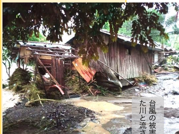
台風の被害のもたらした水害により氾濫した川と流された橋および現地被害の様子